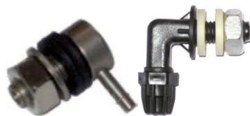
Inox/PP Impfventil 90° Reinigungsmittel