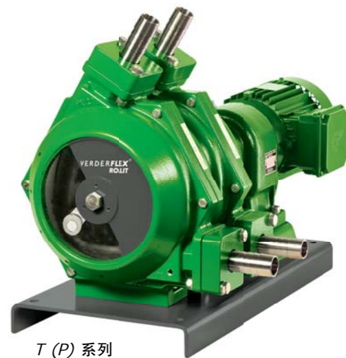
T (P) 系列