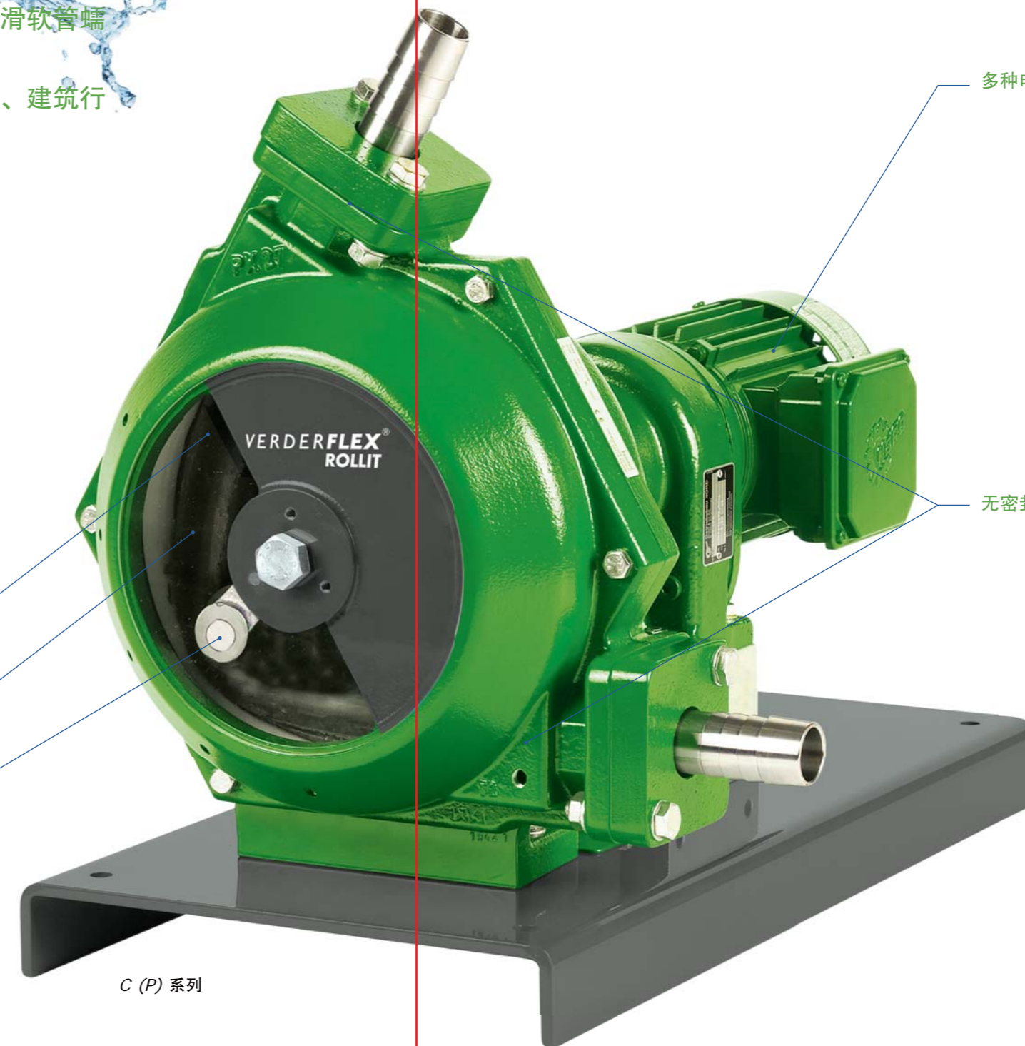
C (P) 系列