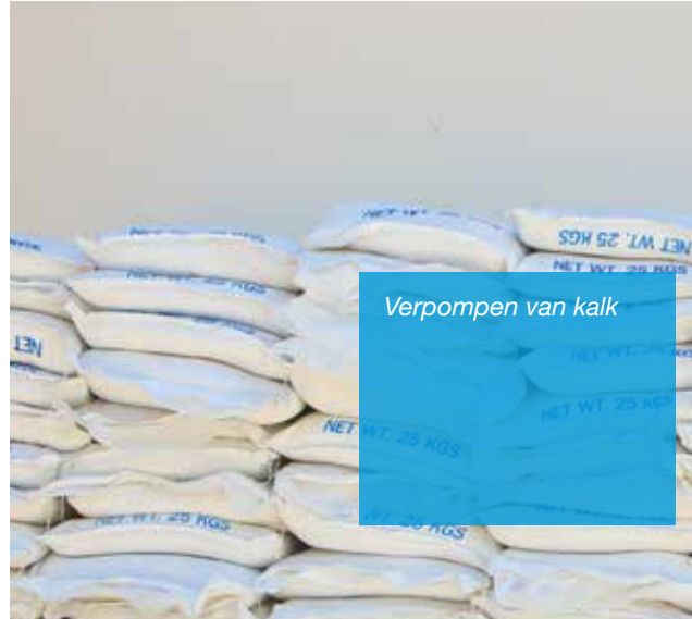
Verpompen van kalk

De Verderhus B close-coupled pomp draait al 36 maanden zonder onderhoud.