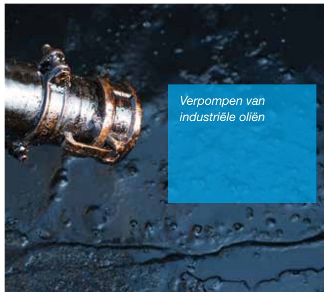
Verpompen van industriële oliën

Er werd een Verderhus 80 x 50A pomp ingezet voor het verpompen van het smeermiddel. Hierbij werd slechts 1,25 kW gebruikt. Deze stroombesparing van 70% leidde tot de installatie van nog eens zeven pompen.