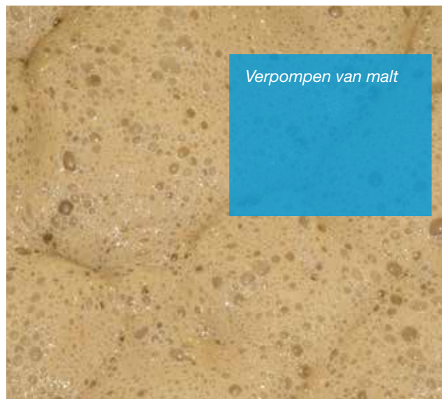
Verpompen van malt

Er werd een Verderhus 150 x 100B kortgekoppelde pomp geïnstalleerd. De probleemloze werking van de pomp leidde tot een bestelling van nog eens vier Verderhus pompen door de klant.